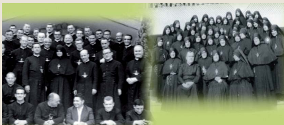
Due Congregazioni, una sola famiglia

La BMS ha mostrato con la sua vita come l'uomo moderno possa conciliare la dimensione verticale con quella orizzontale, del rapporto con Dio e di quello con il prossimo.