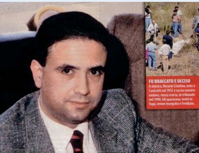
FU BRACCATO E UCCISO A sinistra, Rosario Livatino, nato a Canicattì nel 1952 e ucciso mentre andava, senza scorta, in tribunale nel 1990; gli spararono, tentò la fuga, venne inseguito e freddato.

udienze aveva voluto un crocifisso come richiamo di carità e rettitudine, come pure lo teneva sul suo tavolo, insieme al Vangelo tutto annotato. Nella sua agenda con fiducia totale si affida nelle mani di Dio, così annotando: “STD”, “Sub tutela Dei”, una invocazione medievale, perché Dio aiutasse chi doveva compiere un dovere pubblico.