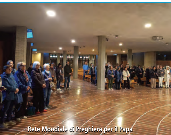
Rete Mondiale di Preghiera per il Papa