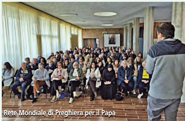
Rete Mondiale di Preghiera per il Papa