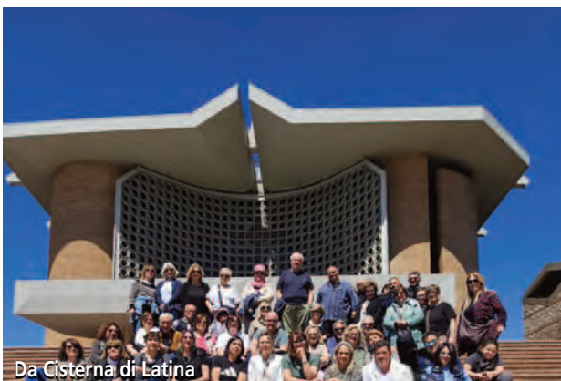
Da Cisterna di Latina