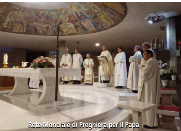
Rete Mondiale di Preghiera per il Papa