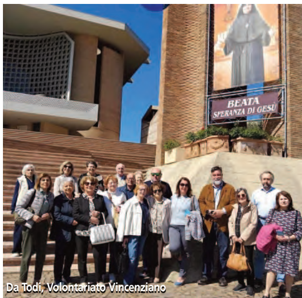
Da Todi, Volontariato Vincenziano